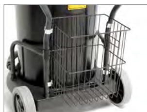
PORTACCESORIOS INDUSTRIAL (OPCIONAL)