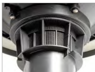
SISTEMA ANTIESPUMA INTEGRADO