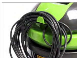
GANCHO PARA CABLE