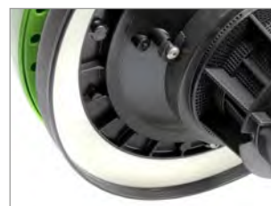
JUNTA INNOVADORA EN EL CABEZAL